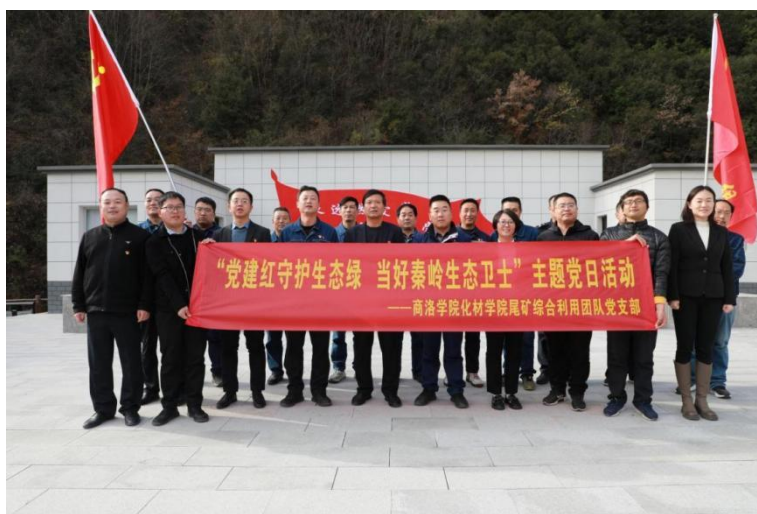
化材学院&大西沟矿业联合技术攻关党支部

(三)在校企联合技术攻关方面形成了可复制可推广的“大西沟模式”。学院尾矿综合利用团队党支部在与该公司联合开展主题党日活动的基礎上，建立深度合作关系，与陕西大西沟矿业有限公司、马鞍山矿业研究院等 5 家单位联合成立的技术攻关临时党支部获陕西省委组织部现场指导并获得肯定，为企业代建尾矿资源综合利用中试基地一个。