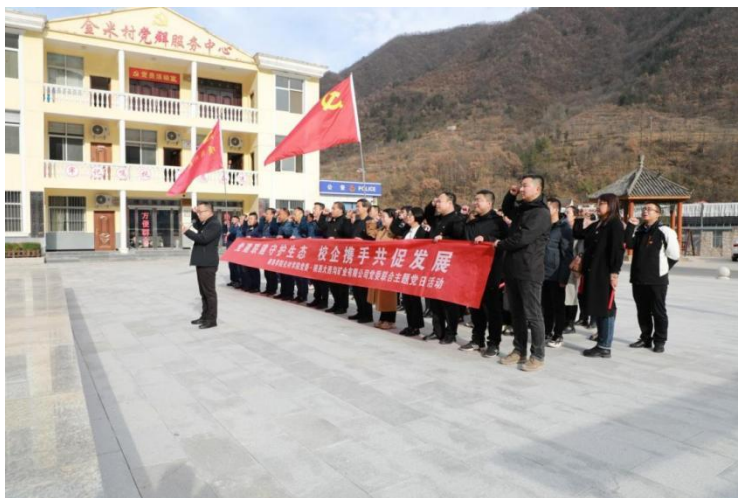
化材学院党委赴柞水县金米村开展主题党日活动

(三)在校企联合技术攻关方面形成了可复制可推广的“大西沟模式”。学院尾矿综合利用团队党支部在与该公司联合开展主题党日活动的基礎上，建立深度合作关系，与陕西大西沟矿业有限公司、马鞍山矿业研究院等 5 家单位联合成立的技术攻关临时党支部获陕西省委组织部现场指导并获得肯定，为企业代建尾矿资源综合利用中试基地一个。